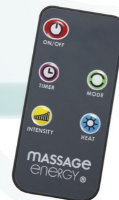
Mando a distancia