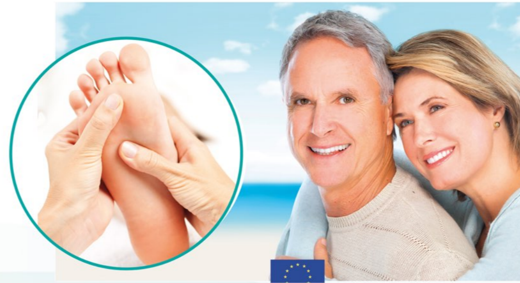
TABLA DE REFLEXOLOGIA PODAL

Reflexología con 16 cabezales situados estratégicamente para cubrir todas las zonas reflejas del pie.